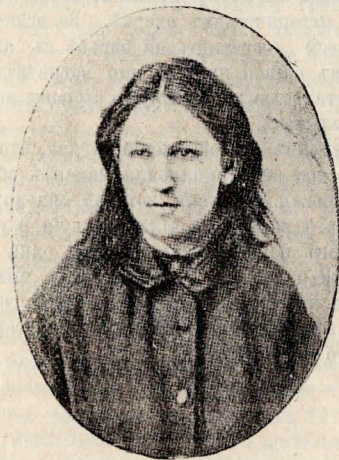
В. И. Засуличъ.

Ко времени изданія этихъ сборниковъ въ Россіи уже образовались кружки социаль-демократовъ, которые вели свою сначала незамѣтную, пропаганду среди рабочихъ. Начали завязываться