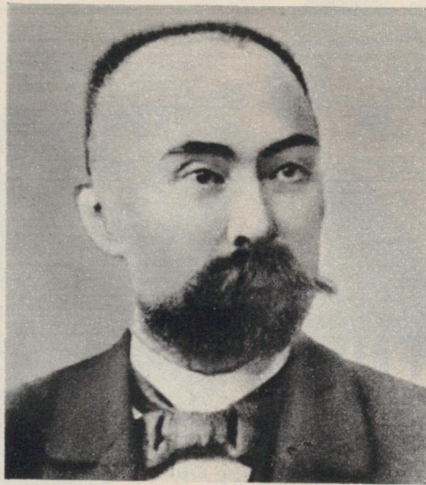
Георгий Валентинович Плеханов.

Спуску нарушителям дисциплины рабочие не дают, но характер наказания разный. Чаще всего не спешат уволить, прогнать. Перед тем как принять подобное решение, хорошенько взвешивают все «за» и «против». Это вовсе не значит, что с явными нарушителями дисциплины не поступают самым суровым образом. Тут не могут не вспомнить о наших товарищеских судах. Само название говорит, что судят-то товарищи товарища! Но бывает и так: пожурят-пожурят пьяницу, да и с богом отпустят. «Больше не буду», — снажает он. И ему верят. А на улице его уже поджидают дружки. Как же, надо ведь обмыть «приговорчик». И обмывают. И «герой дня» куражится перед дружками, что он-де показал судьям кузькину мать. Ничего подобного на собрании настоящей, совестливой бригады происходить не может. Здесь счет один — честь по труду! Здесь неуклонно соблюдается принцип «Зарплата должна быть заработанной!».