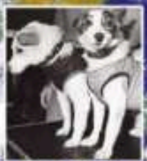
Четвероногие космонавты Белка и Стрелка