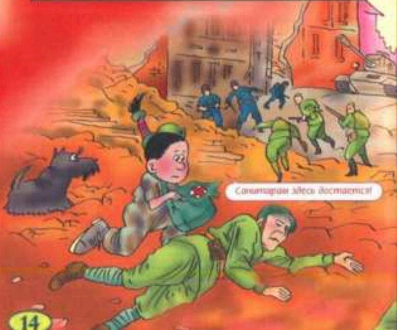
Санитарам здесь достается!

В ноябре 1942 года наши войска перешли в наступление. С севера и юга они двинулись навстречу друг другу. Через два месяца кольцо окружения замкнулось. Окруженная фашистская армия сдалась в плен.