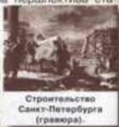
Строительство Санкт-Петербурга (гравюра).

Пётр очень хотел, чтобы новый город походил на знаменитую столицу Голландии Амстердам, где люди не ездили в колясках, а