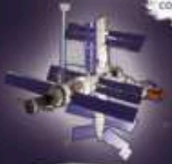
Советская орбитальная станция «Мир»