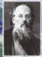
Константин Циолковский (1857–1935) – русский ученый, пионер космонавтики и ракетной техники