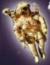
Космонавт в состоянии невесомости