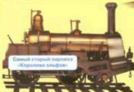
Самый старый паровоз «Королева эльфов»