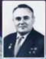
Сергей Королёв (1907–1966) – главный конструктор первых советских космических ракет