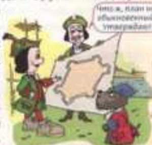
«Инож, план не обыкновенный устроили!»

Типография скоро начала печатать первую в России газету «Санкт-Петербургские ведомости».