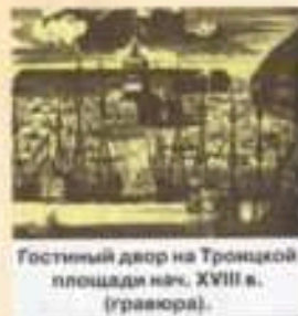
Гостинный двор на Троицкой площади нач. XVIII в. (гравюра).

Первые таблички с названиями улиц были установлены в 1768 году. Примерно в это же время была проведена первая нумерация домов, только не по улицам, а обща по всему городу, в 1781 году в Петербурге был дан под номером 45541. Со временем всё стало на свои места: дома стали считать по улицам.