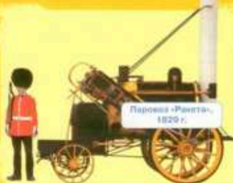
Паровоз «Ракета», 1829 г.

Самый первый маленький паровозик был сильнее двадцати лошадей! А сейчас каждый поезд — будто 6 тысяч лошадей! И едет в шесть раз быстрее!