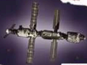
Международная космическая станция