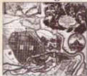
План Санкт-Петербурга, сочинённый при Петре I.

Пётр решил строить город по-особенному, не так, как все другие города в мире.