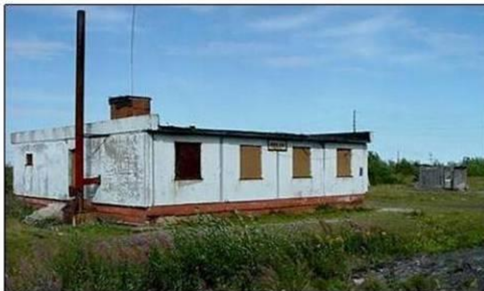
Закрытое здание станции Абезь

По приказу НКВД СССР № 342 от 1 октября 1936 г. была изменена структура управления Ухтпечлага. Вместо бывших 5-ти лагерных подразделений-промыслов решили создать 5 лаготделений по производственному направлению. Абезьский перевалочный пункт состоял из 2-х зон: мужской и женской. Он имел лагучастки, сезонные командировки и подкомандировки.