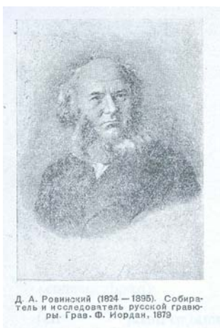
Д. А. Ровинский (1824 – 1895). Собира- тель и исследователь русской гравю- ры. Грав. Ф. Иордан, 1879

Основной принцип классификации эстампных фондов есть принцип тематический. При отнесении материала к той или иной группе систематизации мы исходим из содержания и назначения – функционирования листа. Так, с точки зрения назначения фонды разбиваются на большие группы: плакат, наглядные пособия, открытки, афиши, лубок и массовая картина, прикладная графика.