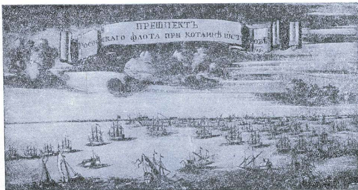
Русский флот при Котлине в 1715 г. Офорт. грав. П. Пикар

Наконец, отделом эстампов совместно с Выборгским домом культуры разработан план организации серии 12 выставок по 12 главам краткого курса Истории ВКП (б), применительно к календарным срокам проведения партийной учебы.