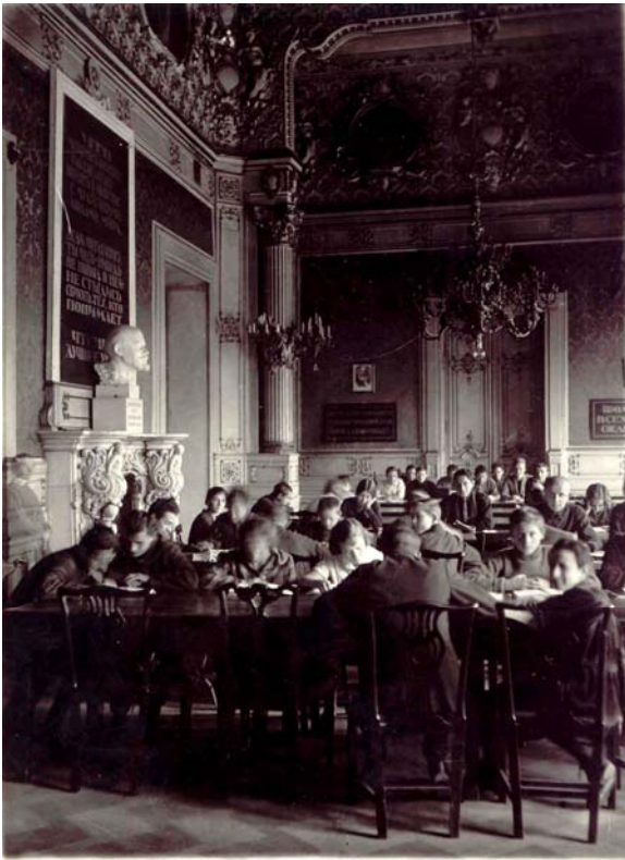
В читальном зале Библиотеки молодежи

уменьшается и уменьшается. Выставки приходится ликвидировать или сводить на ничтожный уровень. В читальном зале царит холод и теснота. С вешалок нас тоже оттесняют». 28 февраля: «Условия работы и для сотрудников, и для читателей непомерно тяжелые. Холод в рабочих комнатах и в читальном зале. Репетиции Дома печати ежедневно проходят рядом с читальным залом в часы его работы» 32 .