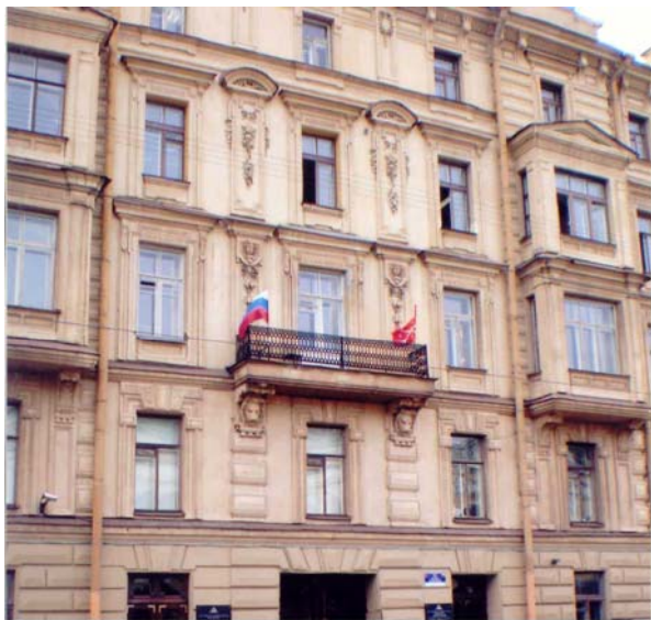
Здание Библиотеки на Садовой уд., д. 18

Тем не менее дирекции пришлось переместить филиал в Главное здание. Сначала, на период ремонта помещений, в здании по Садовой ул., д. 18 за Библиотекой молодежи было закреплено 10 читальных мест в Главном читальном зале, а 7 октября 1928 г. филиал открылся в освобожденном от бывших квартир библиотекарей помещении, где было оборудовано 150 читальных мест.