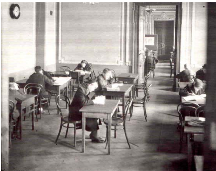
Интерьеры Библиотеки молодежи