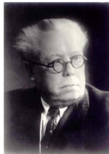
Николай Севастьянович Державин

Как уже отмечалось выше, открытие этого филиала первоначально намечалось к октябрьским праздникам 1925 г., и уже в сентябре 1925 г. в редакцию адресной книги «Весь Ленинград» были направлены сведения о Публичной библиотеке, в которых наряду с другими данными сообщалось о функцио-