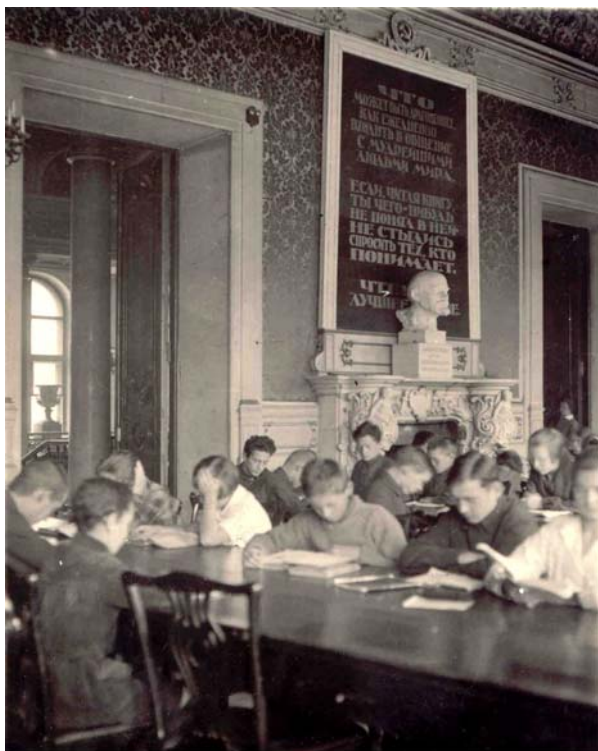
Читатели Библиотеки молодежи

жению. По остальным отраслям знания – минимум марксистски выдержанной и актуальной литературы, рассчитанной на удовлетворение запросов комсомольского актива» 53 . Намечались и соответствующие источники пополнения фонда: 1) отбор литературы из второго обязательного экземпляра Публичной библиотеки; 2) получение книг от издательства «Молодая гвардия» (кроме беллетристики); 3) приобретение литературы через партийно-комсомольскую группу бибколлектора. Естественно, такой профиль комплектования снижал интерес читателей – учащихся школ, рабфаков, техникумов, школ фабрично-заводского ученичества и т. п., составлявших до этого наиболее значительную и активную часть читательского контингента этого филиала.