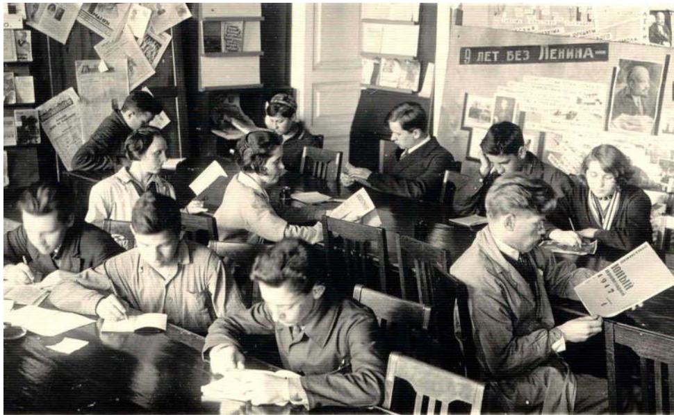
Читатели Библиотеки молодежи

Создание Библиотеки молодежи и ее деятельность привлекали внимание библиотечной общественности и работников просвещения. В нее приезжали специалисты из различных районов страны для ознакомления с новым типом библиотечного учреждения. Только в 1926 г. в ней побывали сотрудники Московского института детского чтения и Рогожско-Симоновского райкома партии Москвы, библиотечные работники Украины, Сибири, преподаватели Ленинградского педагогического института им. А. И. Герцена, Дома политического просвещения Василеостровского района Ленинграда и др. С деятельностью Библиотеки молодежи знакомились многие участники проходившей в Ленинграде Второй всероссийской конференции научных библиотек, в их числе руководящие работники Главнауки Наркомпроса, Государственного ученого совета, Украинской книжной палаты и др. Опыт работы этого филиала привлек внимание и участников проходившей в Москве Всероссийской конференции детских библиотек, где, помимо основных тем, специально обсуждался вопрос о библиотечном обслуживании юношества на примере Библиотеки молодежи. В резолюции конференции отмечалась необходимость налаживания особой работы с юношеством, организации в крупнейших центрах республики специальных юношеских библиотек по образцу молодежного филиала Публичной библиотеки, а в губернских центрах – открытия юношеских отделений при центральных библиотеках для взрослых 25 .