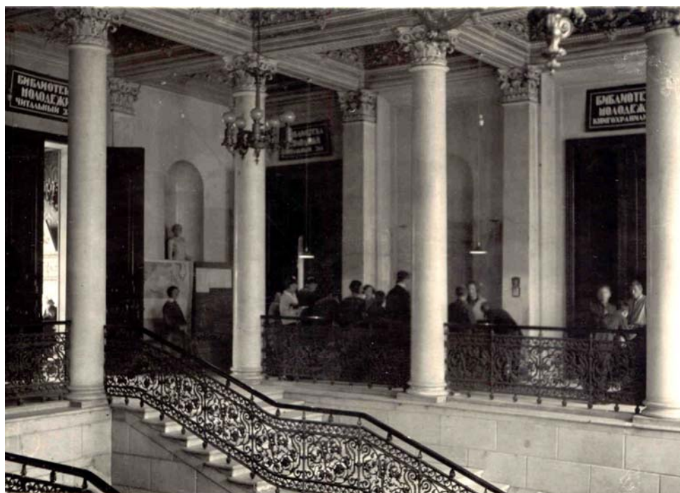
Главный вход в Библиотеку молодежи

нировании Библиотеки молодежи в качестве филиального отделения Публичной библиотеки. Однако острый недостаток средств и затянувшийся в связи с этим ремонт помещений отодвигал сроки открытия, о чем Николаева известила губком ВЛКСМ. Клубная комиссия губкома 17 сентября 1925 г. в письме в дирекцию Библиотеки сообщала, что «развертывание сети политеобразования по организации и незначительности сети комсомольских библиотек в Ленинграде требует скорейшего открытия библиотеки. Работа комсомольских библиотек (с 3500 томов) требует улучшения и углубления методики повышения квалификации библиотечных работников – [прежде всего] молодежи, [и] это возможно лишь при наличии филиального отделения Российской Публичной библиотеки как инструктивного пункта. Все это ставит задачу приблизить срок открытия филиального отделения хотя бы к октябрьским торжествам» 19 .