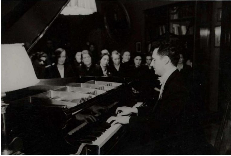
В. В. Софроницкий за роялем на концерте в Мемориальном музее им. А. Н. Скрябина в Москве.