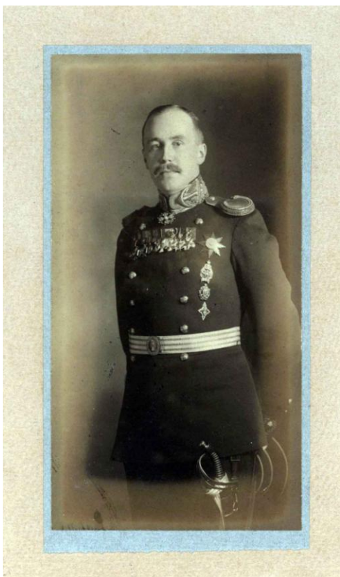
Ларионов Леонид Васильевич. Капитан I ранга, командир яхты морского министра «Нева». 1917 г.

вахтенным офицером на яхту морского министра «Нева». В 1911 г. – старший лейтенант, в 1913 – капитан 2 ранга, в декабре 1916 г. капитан 1 ранга.