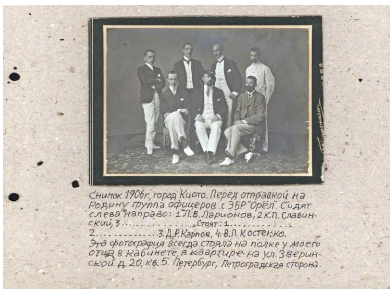
Офицеры эскадренного броненосца «Орел» перед возвращением из плена в Россию. Киото (Япония). 1906 г.