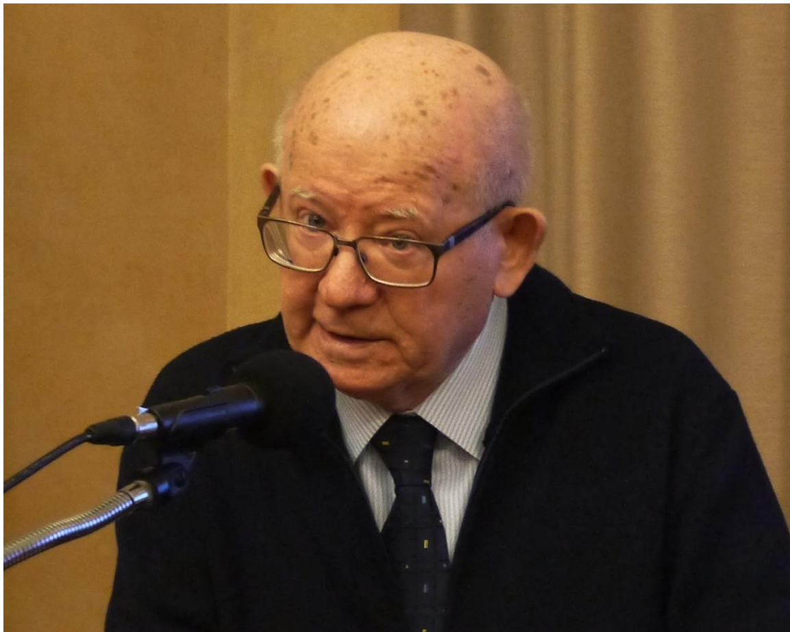
Борис Львович Фонкич