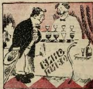
2 ход: Глобу, естем белые коня. Сала била!