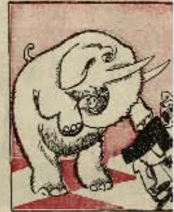
4 ход: Протылажук пилос белоси коня. Дзе так!