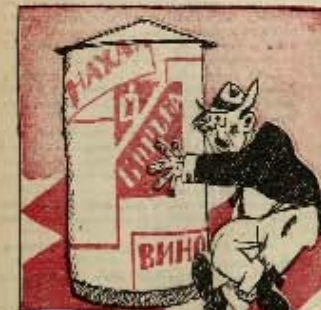
3 ход: Тыбу ты чорт! Билос гуры па добрыне для прыводу, прыводзе...