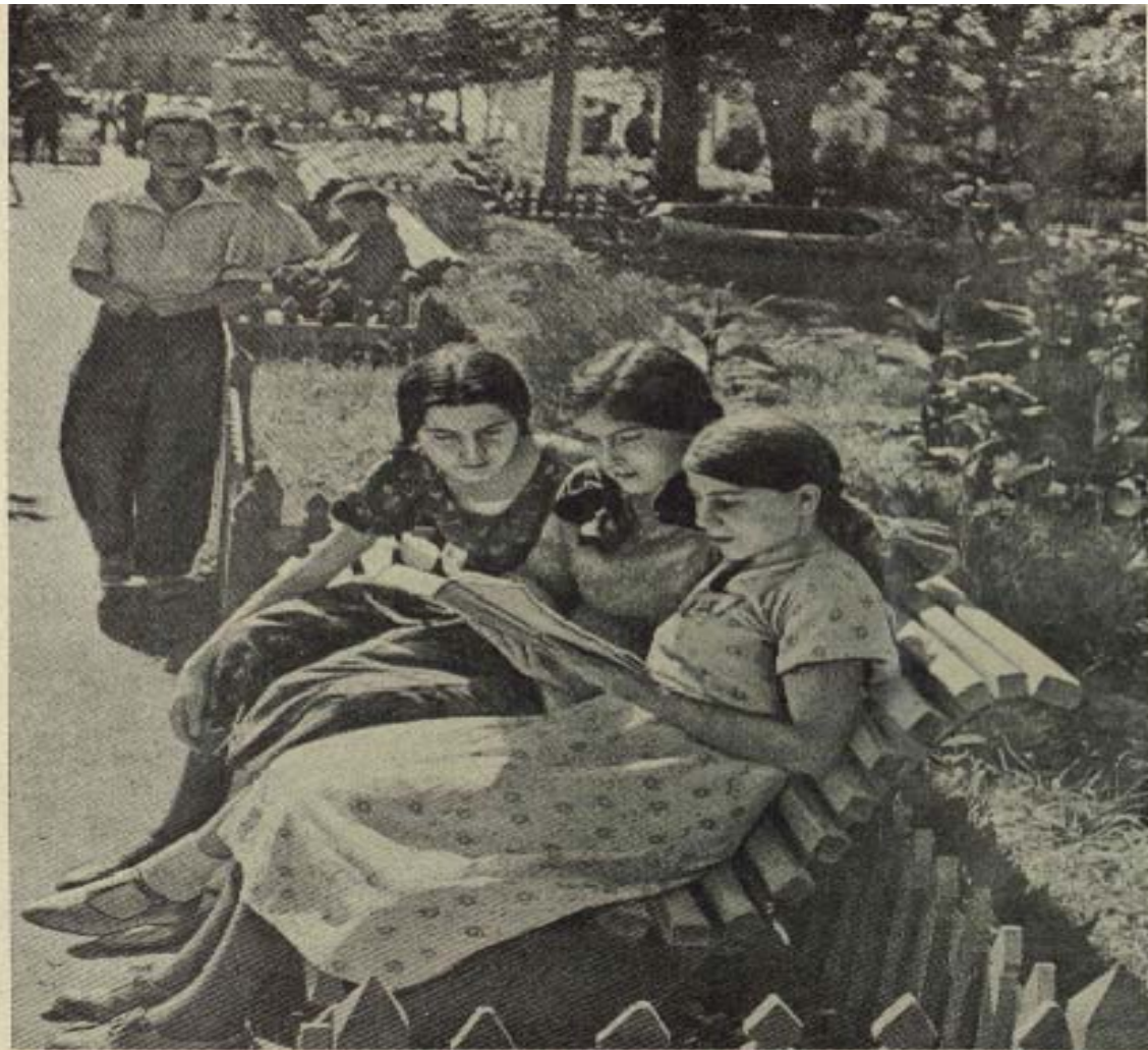
На бульваре имени Косарева в Сигнале (Труньи)