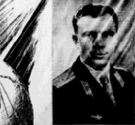
Юрий Алексеевич Гагарин.