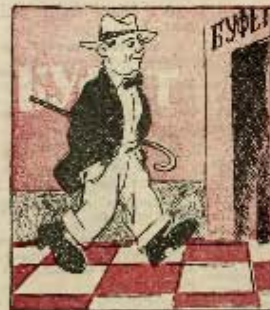
1 ход: Билос пошел...