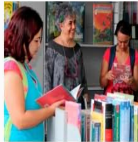
Biblioteca Pública Altavista