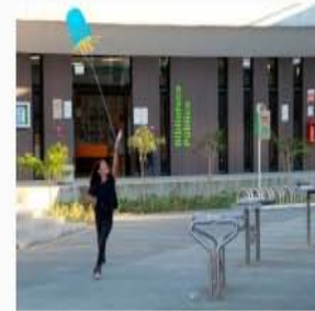
Biblioteca Pública El Poblado