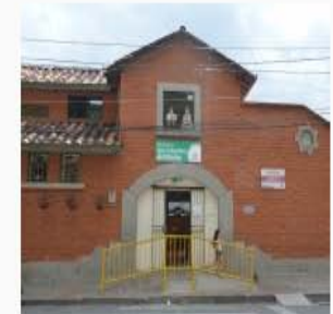
Biblioteca Público Corregimental San Sebastián de Palmitas