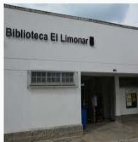
Biblioteca Público Corregimental El Limonar