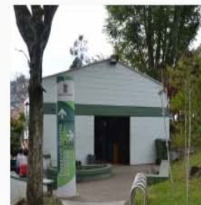
Biblioteca Público Barrial Fernando Gómez Martínez