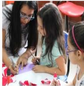
Biblioteca Pública Ávila