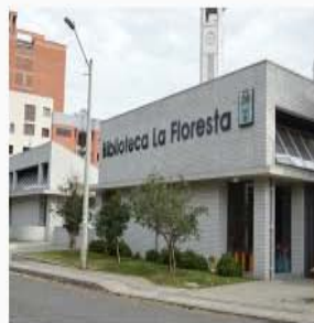
Biblioteca Público Barrial La Floresta