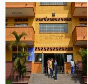
Biblioteca Público Escolar Granizal