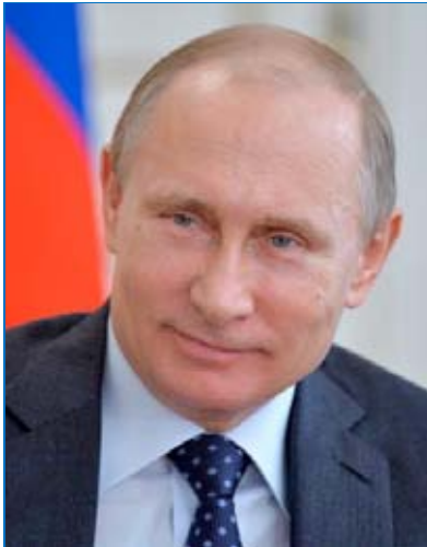
Президент Российской Федерации В.В. Путин

Проект модернизации муниципальных библиотек в регионах России