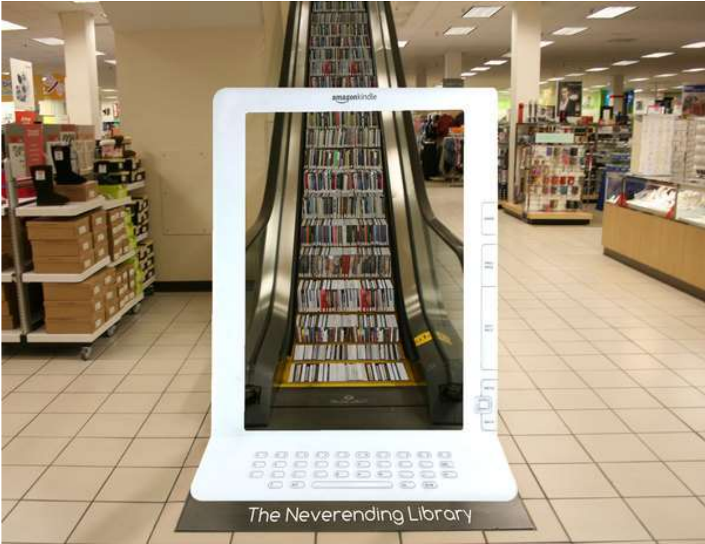
The Neverending Library