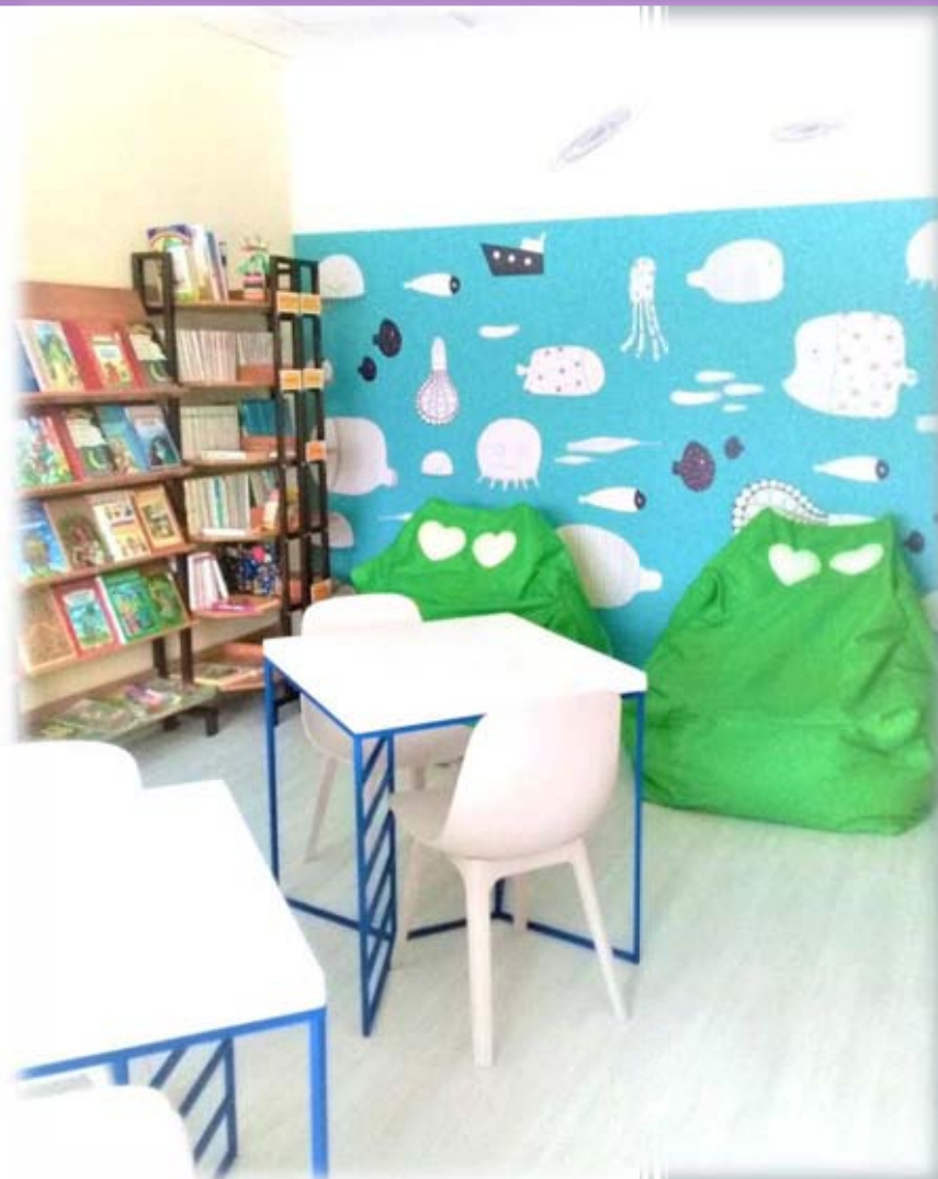
Детская зона обслуживания в библиотеке пос. Лыхма Белоярского района