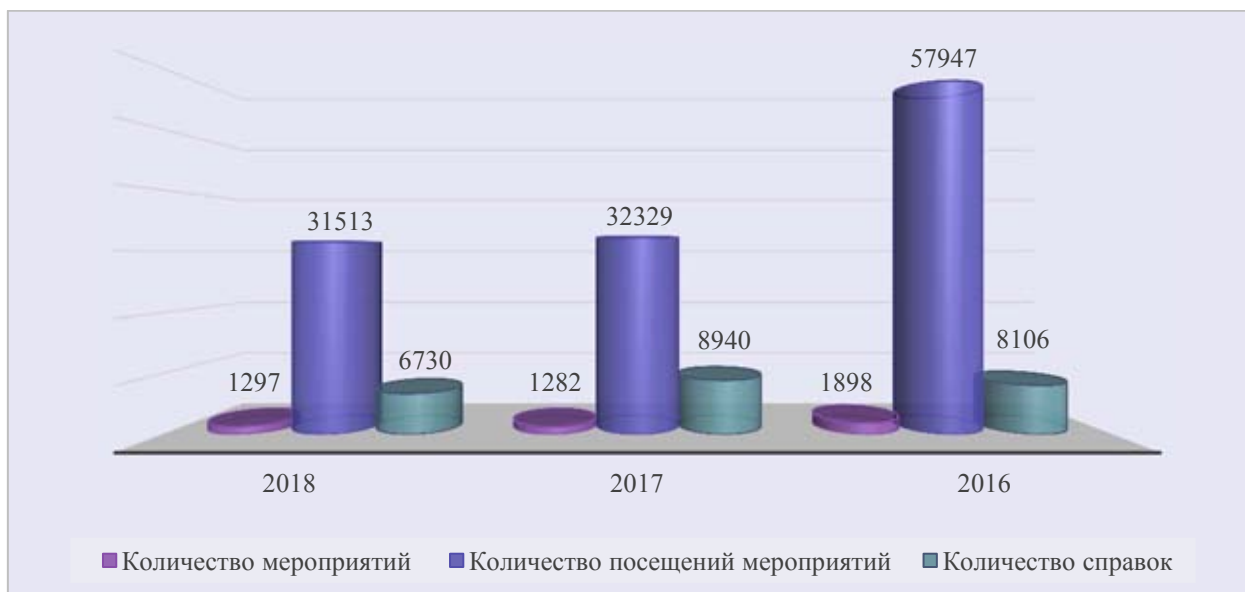
Динамика показателей, характеризующих деятельность библиотек по пропаганде здорового образа жизни (2016–2018 годы)

Библиотеки автономного округа осуществляли деятельность по пропаганде здорового образа жизни в рамках муниципальных программ и собственных проектов.