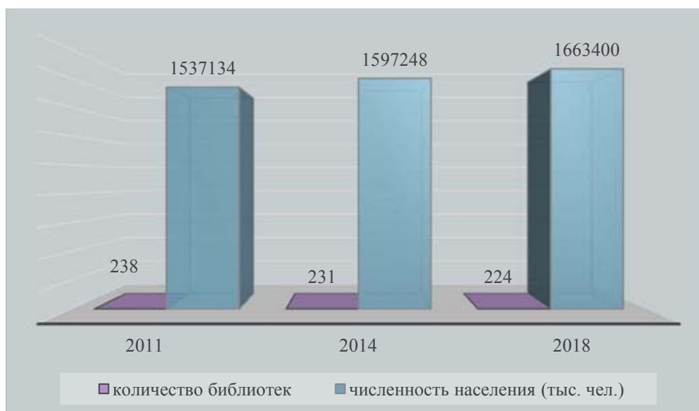
Диаграмма демонстрирует, что за 2011–2018 годы население выросло на 8 %, а сеть библиотек сократилась на 6 %.

Динамика численности населения и количества общедоступных библиотек (2011–2018 годы)