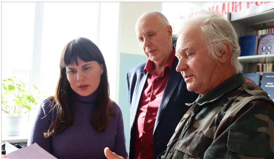
Экспедиция в с. Золотовку Ржаксинского района 29.09.2020