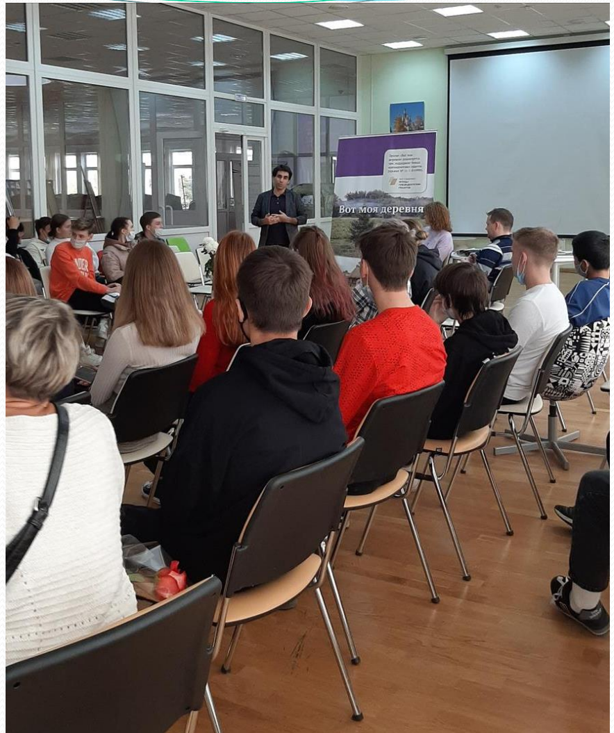
Мастер-класс «Время сохранять: важные идеи для изучения семейной истории» 27.09.2021