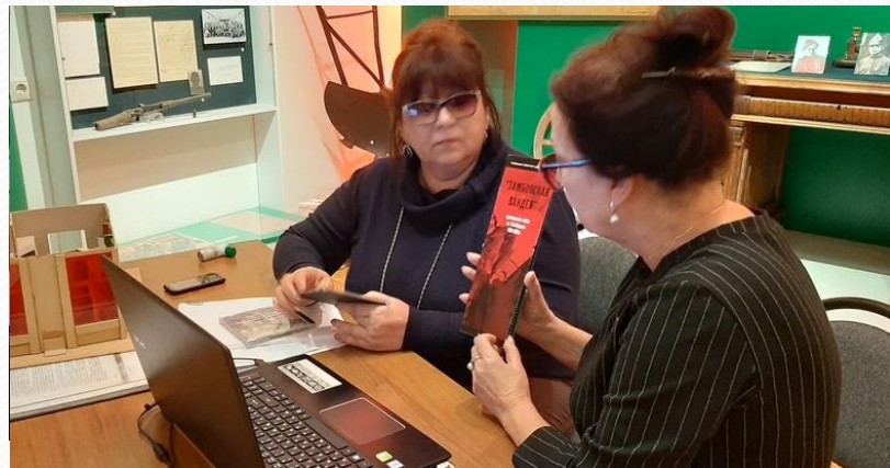
Мастер-класс «Порядок подготовки выставок музейных экспонатов» (проведен онлайн в веб-сервисе Zoom) 18.09.2020