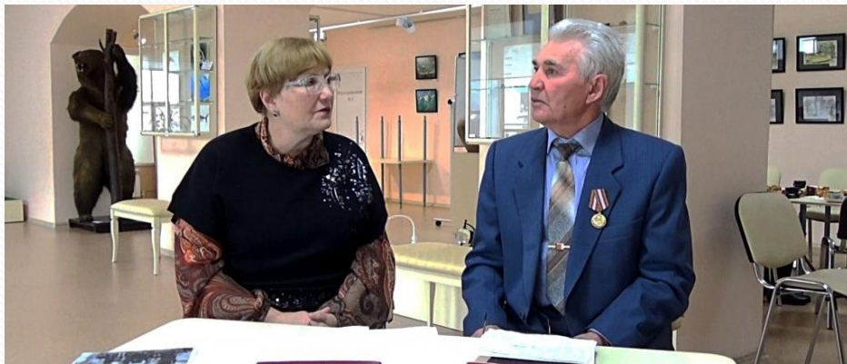
Сбор воспоминаний (поездка в Курсановский район Тамбовской области, 28.01.2021)