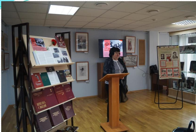
Мастер-класс «Основы работы по расшифровке дневников участников Великой Отечественной войны», 19 сентября 2019