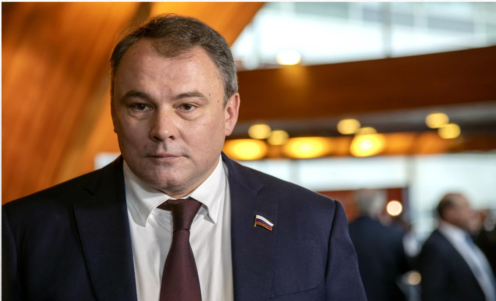
Вице-спикер Пётр Олегович Толстой