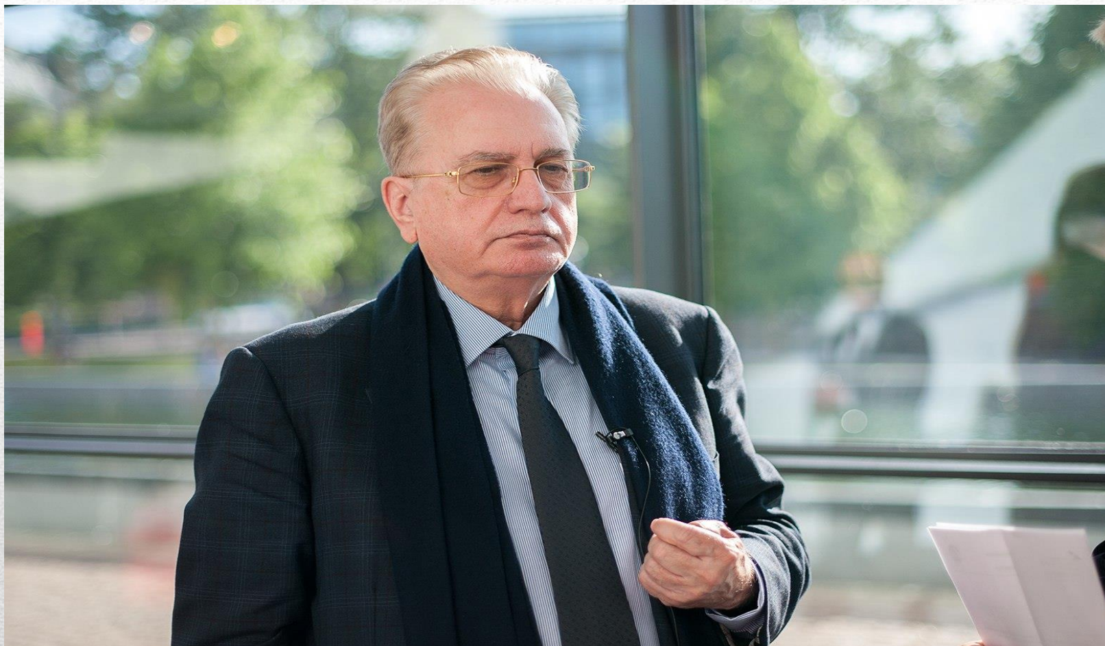
Михаил Борисович Пиотровский директор Эрмитажа