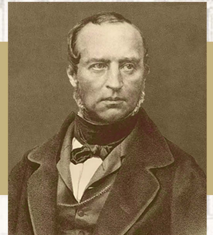
В. Ф. ОДОЕВСКИЙ 220 ЛЕТ СО ДНЯ РОЖДЕНИЯ