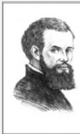
ВЕЗАЛИЙ Снимок экрана