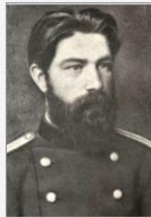
БИАНКИ Валентин Львович