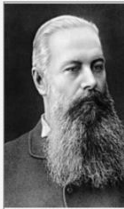
ДОКУЧАЕВ Василий Васильевич