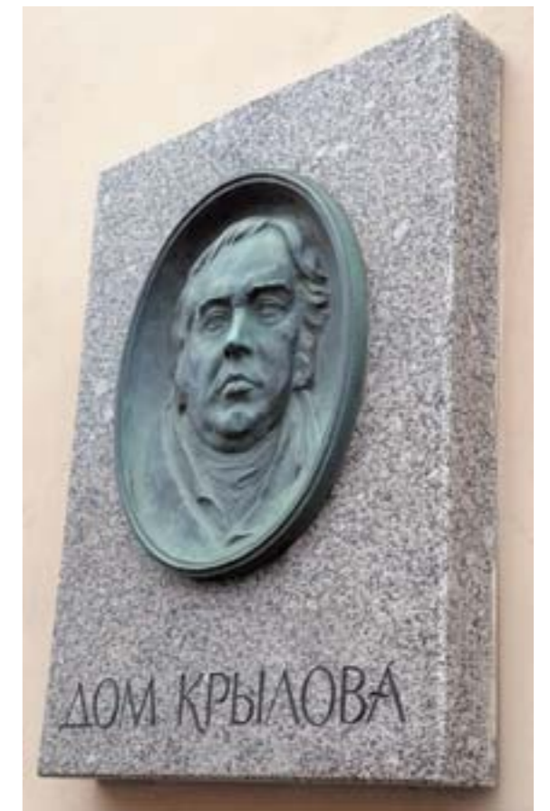
Памятная доска на Садовой ул., 20 (Доме при библиотеке, где жил И.А. Крылов).

Между тем было рекомендовано на его место найти «надёжного чиновника, который бы мог содействовать устройству библиотеки в порядке, как при Крылове».