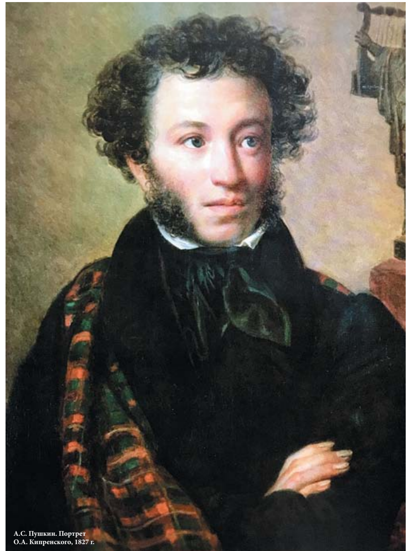
А.С. Пушкин. Портрет О.А. Кипренского, 1827 г.