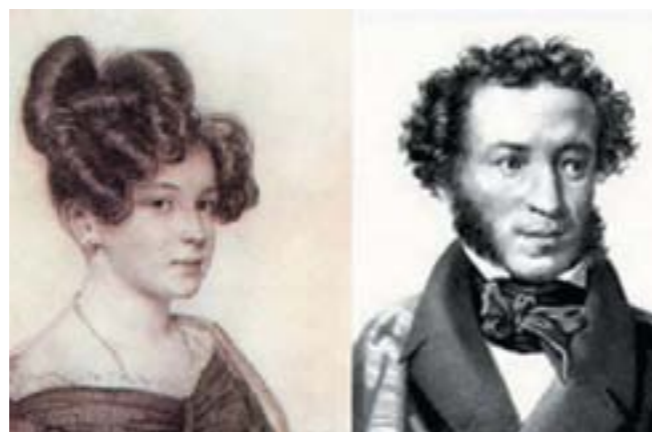
А.С. Пушкин и А.А. Оленина.

В 1828 г. после очередного визита к Олениным Александр Сергеевич настолько увлёкся мыслью о женитьбе на Анне Алексеевне, что не только рисовал её на полях своих рукописей, но и примерял её имя к своей фамилии – Annete Pouchkine (Аннет Пушкина). Анна Алексеевна к поэту относилась двояко: его необузданный темперамент и талант восхищали и пугали её. Она решила посоветоваться с тем, кому доверяет отец и кто является авторитетом для