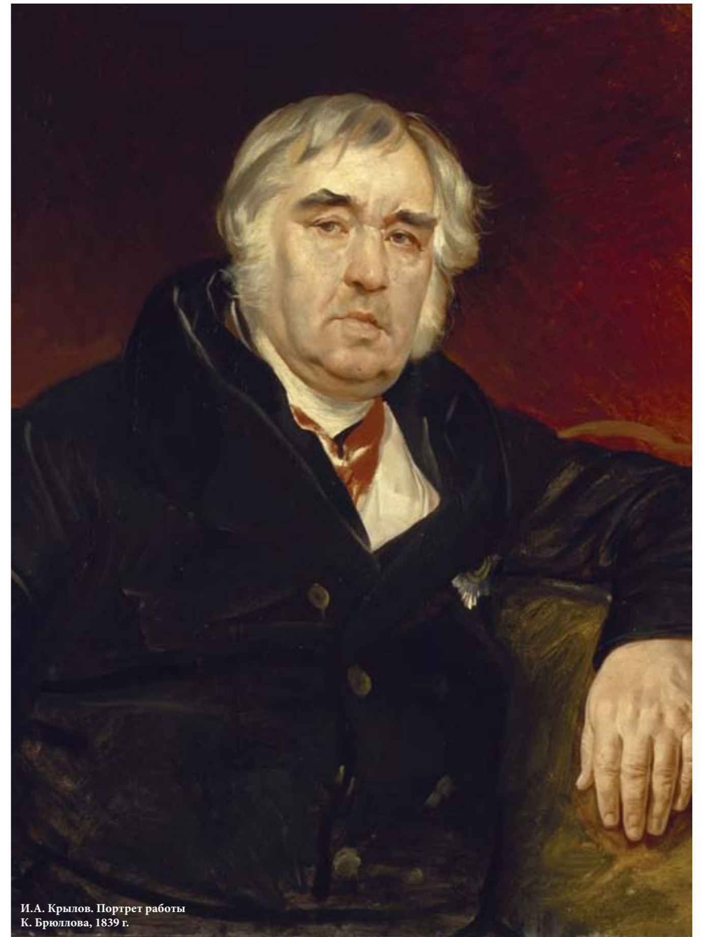
И.А. Крылов. Портрет работы К. Брюллова, 1839 г.