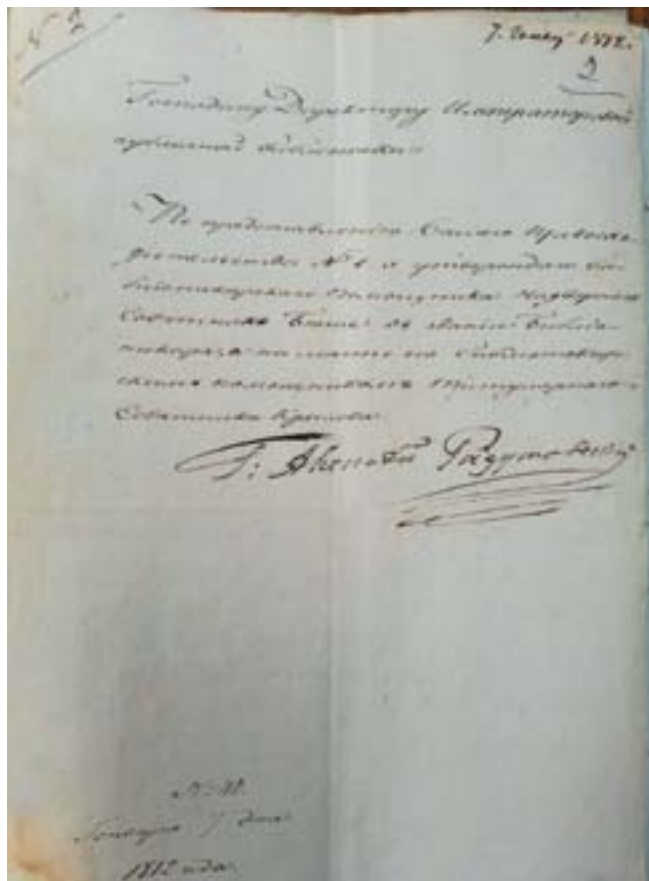
Согласие министра просвещения Алексея Разумовского о приёме на работу в библиотеку И.А. Крылова.