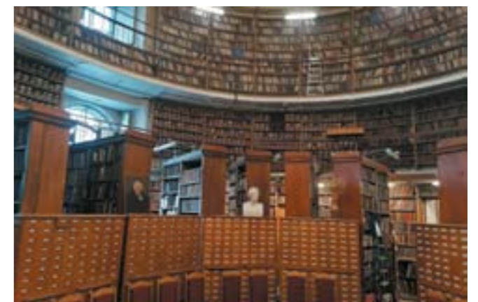
Русский фонд Российской национальной библиотеки.

Ивану Андреевичу оформили отставку 1 марта 1841 г., решением императора оставили полную зарплату как действующему сотруднику «по уважению его долговременной службы, а также отличных заслуг, оказанных им отечественной словесности», оформили пенсию.