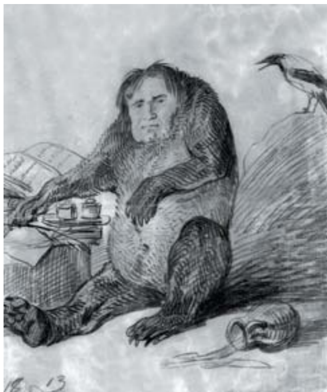
Портрет-кариатура «Крылов – медведь» художника А.О. Орловского (из фонда рукописей РНБ).

Однако это, как вскоре выяснилось, была при- сказка. Написать сказку жизни и творчества ему помог управленческий гений Алексея Николаевича Оленина, директора Императорской публич- ной библиотеки с 1811 по 1843 г.