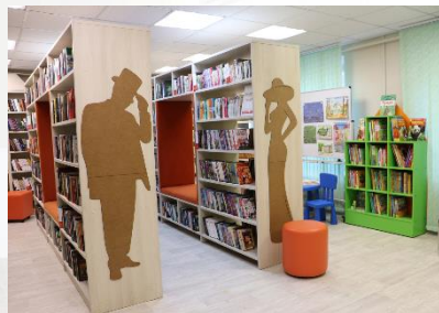
Центральная библиотека имени Л.А. Малюгина (г. Касимов)