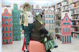
Детская библиотека имени А.В. Ганзен (г. Касимов)