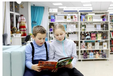
Библиотека-филиал №12 ЦБС г. Рязани