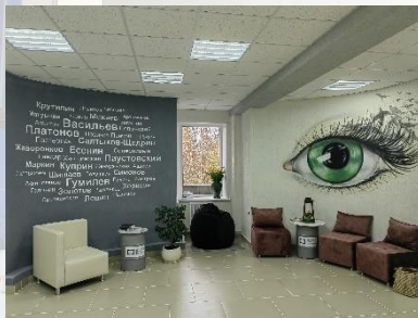
Библиотека-филиал №9 имени П.Н. Васильева ЦБС г. Рязани