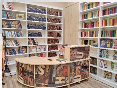
Центральная библиотека Сасовского района