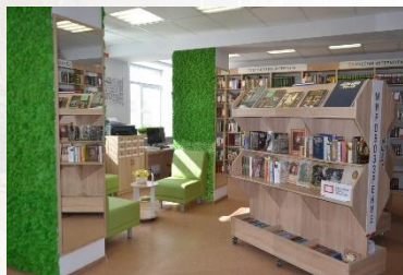
Хиринская сельская библиотека Рязанского района