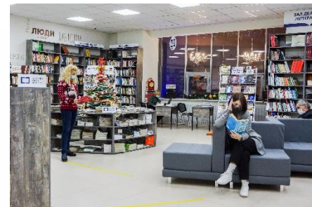
Центральная городская библиотека имени С.А. Есенина (г. Рязань)