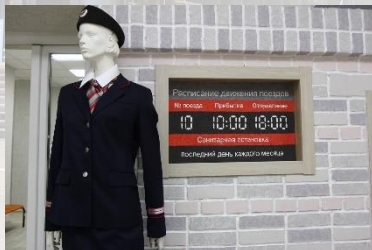
Библиотека-филиал № 10 ЦСДБ г. Рязани