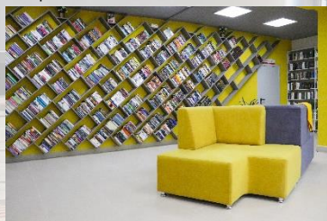
Библиотека-филиал № 7 ЦБС г. Рязани