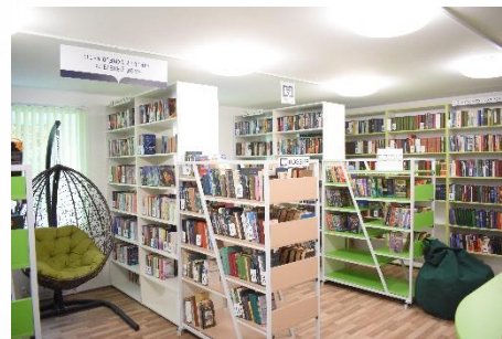
Центральная библиотека имени Б.А. Можаява Пителинского района