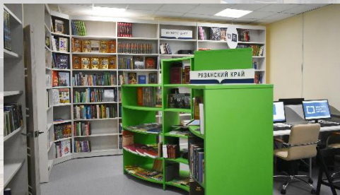
Городская библиотека №1 Рязанского района