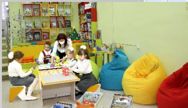
Баграмовская сельская библиотека Рыбновского района