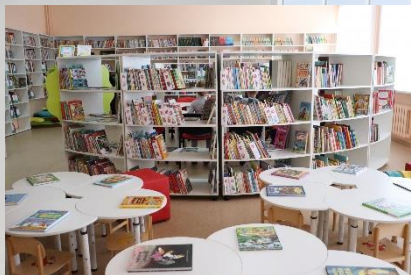
Ижевская сельская библиотека Спасского района