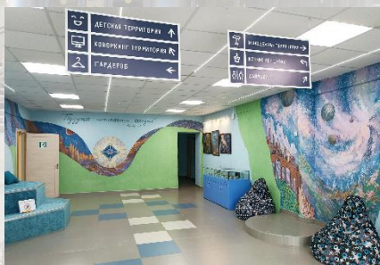
Центральная детская библиотека ЦСДБ г. Рязани