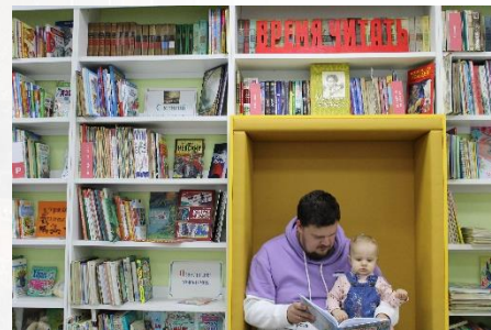
Детская библиотека Шацкого района