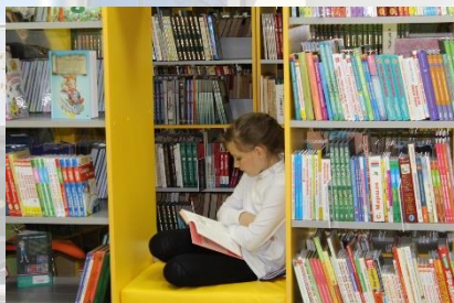
Центральная детская библиотека Рыбновского района