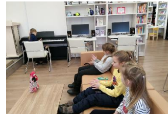
Пехлецкая сельская библиотека Кораблинского района