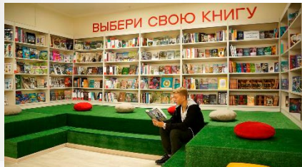
Елатомская поселковая библиотека Касимовского района