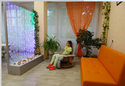
Библиотека-филиал №5 ЦСДБ г. Рязани