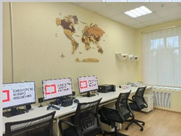
Межпоселенческая библиотека имени Н.С. Гумилёва Шиловского района