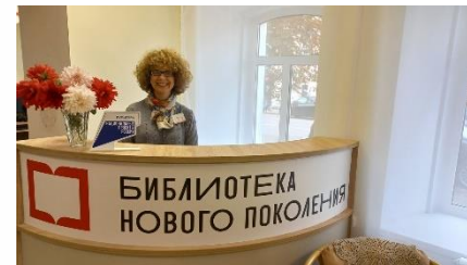
Центральная библиотека Скопинского района