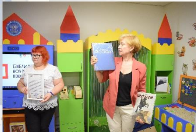
Детская модельная библиотека Пителинского района