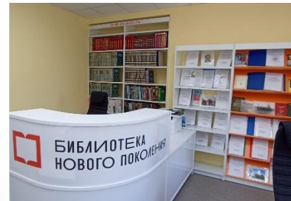
Можарская сельская библиотека Сараевского района