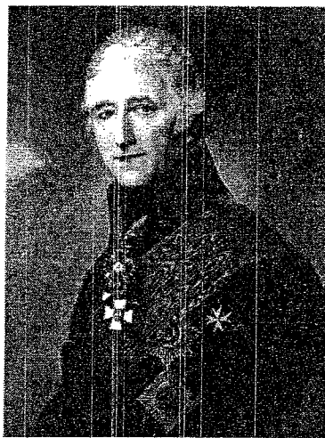
П. К. Сухтелен. Портрет работы неизвестного художника 1803 г. (Русский музей)

До октября 1802 г. управление артиллерийским и инженерным ведомствами находилось в ведении Артиллерийской экспедиции Военной коллегии. Сухтелен предложил разделить ее на Артиллерийскую и Инженерную экспедиции для придания более высокого значения инженерному ведомству. Император утвердил это предложение, и 23 октября Петр Корнилиевич был назначен инспектором Инженерного департамента и управляющим Инженерной экспедицией. На этих постах он многое сделал для развития инженерных войск в России, численный состав которых при нем увеличился в пять раз. В 1804 г. по его предложению была учреждена школа при Чертежной экспедиции, реорганизованная в 1810 г. в Инженерное училище со специальными офицерскими классами.