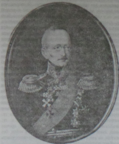
А. И. Михайловский-Данилевский. 1847 г. Акварель, гуашь, кость. Художник А. Лисенко