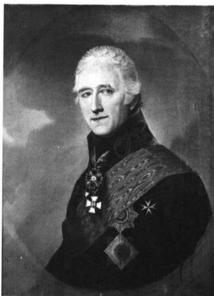
Jan Pieter van Suchtelen (doek; coll. Russisch Museum Sint-Petersburg).

leer. Hierna keerde hij naar huis terug met het besluit om (toch) in krijgsdienst te treden. Zijn vader onderwees hem daartoe in de wiskunde. 35