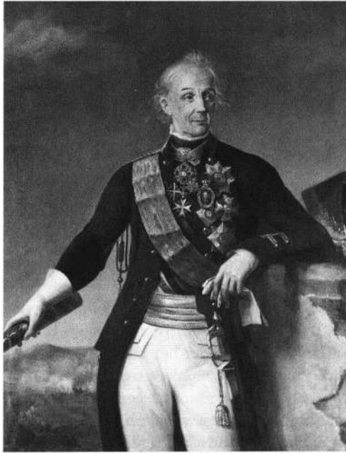
Alexander V. Suworov-Rymniksky

De bestorming van Izmail in 1790 is het meest tot de verbeelding sprekende