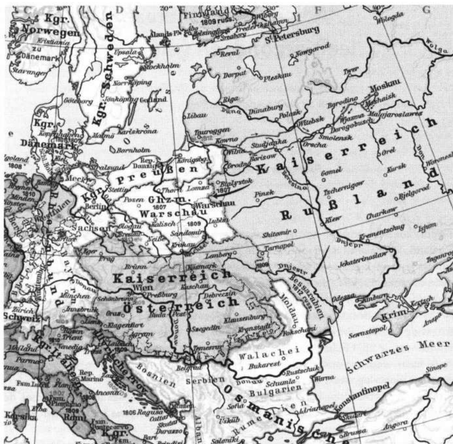
Fragment van de kaart Europa onder Franse heerschappij, 1812 (uit: Westermann Grosser Atlas zur Weltgeschichte (Braunschweig 1976)).

In dezelfde tijd verkeerde Rusland in een periode van expansie. Hierdoor was er behoefte aan buitenlandse specialisten, in het bijzonder ook aan officieren, vanwege de oorlogen die Rusland voerde.