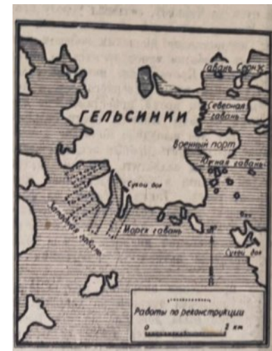
Ил. 3. Гельсинки // Красный флот. 1939. 14 апр. С. 4

ил. 2) При этом в очередной раз особо подчёркивается интерес нацистов к Финляндии: