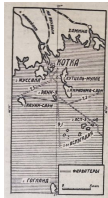
Ил. 2. Шхерный район Котка // Красный флот. 1939. 20 февр. С. 4

Нужно отметить, что если в центральных газетах («Правда», «Известия», «Комсомольская правда» и др.) этим сюжетам были посвящены лишь небольшие заметки, то в специализированных изданиях публиковались целые циклы статей. Например, в начале 1939 г. на страницах «Красного флота» (орган Народного комиссариата ВМФ СССР) было опубликовано несколько больших статей о Финляндии. В одной из них подробно рассматривается шхерный район вокруг города Котка 7 . Автор анализирует особенности судоходства в этом регионе и его роль в возможном конфликте, также была опубликована карта района (см.