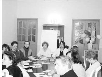
Заседание с библиотекарями членов научной секции «Психология и педагогика чтения» СПб Психологического общества