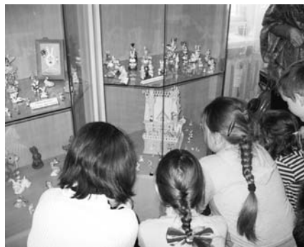
Витрина с заячьим домом

Для размещения поделок выделен целый зал музея. В этой комнате также размещена экспозиция, включающая небольшую часть русской избы, печь с зайчихой-хозяйкой, одетой в сарафан. Её соседи-зайчишки уютно расселись за столом и пьют чай. Тарелки, чашки, ложки, полотенца и салфеточки — всё украшено зайчатами. Есть в музее зайцы, сделанные руками профессиональных мастеров Москвы, Коврова, Муром, Гусь-Хрустального, Дзержинска, Ярославля, Санкт-Петербурга, Ростова