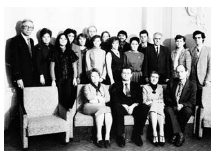
Аспиранты библиотечного факультета. 1 курс, 1986 г.