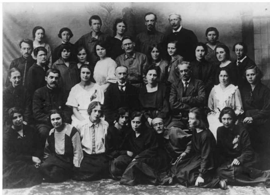
Выпуск Книжно-библиотечного факультета. 1924 г.