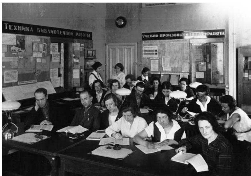
В читальном зале. 1933 г.