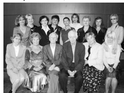
Состав кафедры, 2008 г.

По тем сведениям, которые удалось разыскать на настоящий момент, наши выпускники работали и продолжают работать, конечно, в первую очередь, в таких вузах России, как: СПБГУКИ