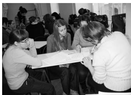
Студенты на занятиях по Основам педагогического мастерства

изучения учебного материала, психологически комфортных способов общения, снятия стрессовых ситуаций учения. Даже если один студент недоволен, надо задать вопросом: а почему? Что его тревожит? Я всегда исхожу из «презумпции невиновности» студентов, но следую правилу: способствовать их личностному росту «не в лоб», а исподволь, разными окольными путями, используя мягкие приёмы «психологических крючочков».