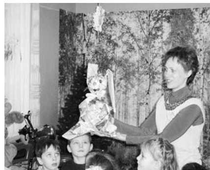
Заяц, сделанный из газет